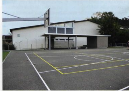
L'école de Courchapoix, 400 habitants, a bénéficié d'un coup de pouce bienvenu.

l'établissement scolaire ont aussi pu être réaménagés grâce à cette somme qui représente les deux tiers de l'ensemble des travaux effectués. Le 29 août dernier, les élèves, la population, les autorités communales et deux ministres jurassiens ont accueilli «en grande pompe» le Conseil de fondation du Patenschaft, qui participait pour la première fois à une telle réception en Suisse romande. La fête a été l'occasion de remercier les généreux donateurs de l'«Unterland zurichois» mais aussi de préciser qu'il n'était pas question ici de charité mais plutôt