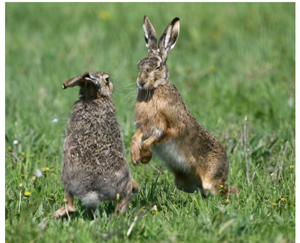
Lièvres bouquinant dans un pré.

Les corporations concernées, au premier chef les agriculteurs et les chasseurs, seront informées du déroulement du plan et de ses résultats. L'information sera également transmise aux instances politiques, aux organisations concernées et au grand public une fois par année, grâce à l'outil que vous tenez en main !