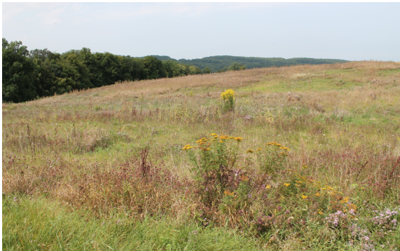
Jachère florale particulièrement favorable, aérée et ensoleillée (Coeuve).

Les SCE seront gérées de manière favorable au lièvre, par exemple en maintenant 10 % des prairies non fauchées à chaque passage.