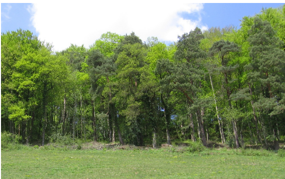
Lisière restaurée à Delémont.

En complément, des lisières étagées comportant un ourlet herbacé seront aménagées dans le cadre du programme biodiversité en forêt mené par l'Office de l'Environnement.