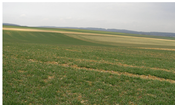
Paysage agricole favorable et défavorable au lièvre (Vendlincourt)

Les expériences menées dans d'autres cantons montrent l'effet positif indubitable d'une bonne