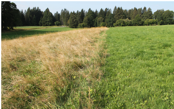
Prairie peu intensive avec 10 % non fauché au mois d'août (Le Peuchapatte).

En complément, des lisières étagées comportant un ourlet herbacé seront aménagées dans le cadre du programme biodiversité en forêt mené par l'Office de l'Environnement.