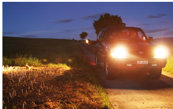
Le monitoring du lièvre se fait par comptages nocturnes sur itinéraires échantillons.

Les mesures du plan d'action, qui sont détaillées ci-dessous, sont pour certaines déjà opérationnelles grâce aux réseaux OQE validés dans le canton. L'application généralisée du plan devrait ces prochaines années renforcer cette évolution positive.